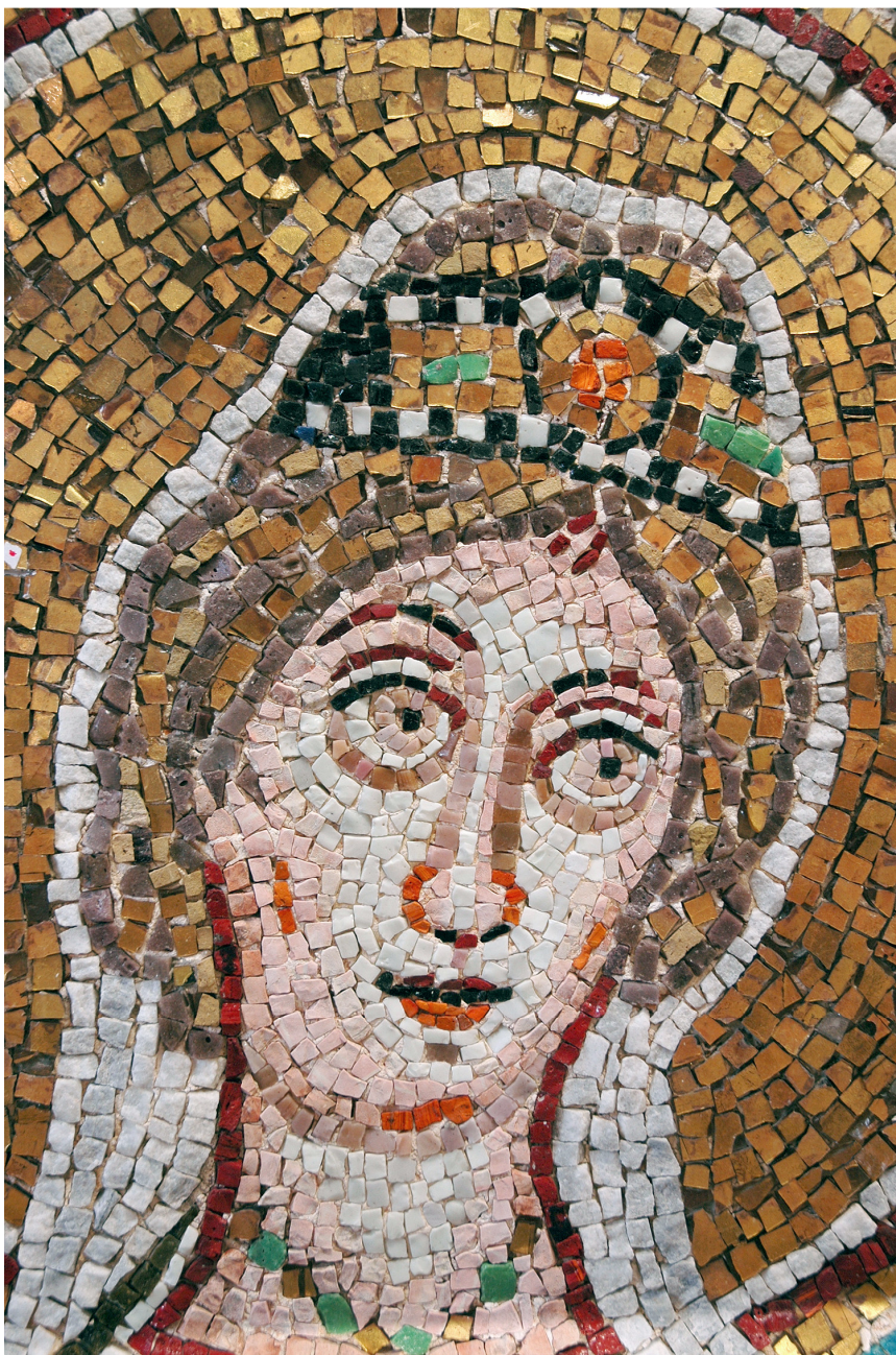
7 la Vergine Eugenia