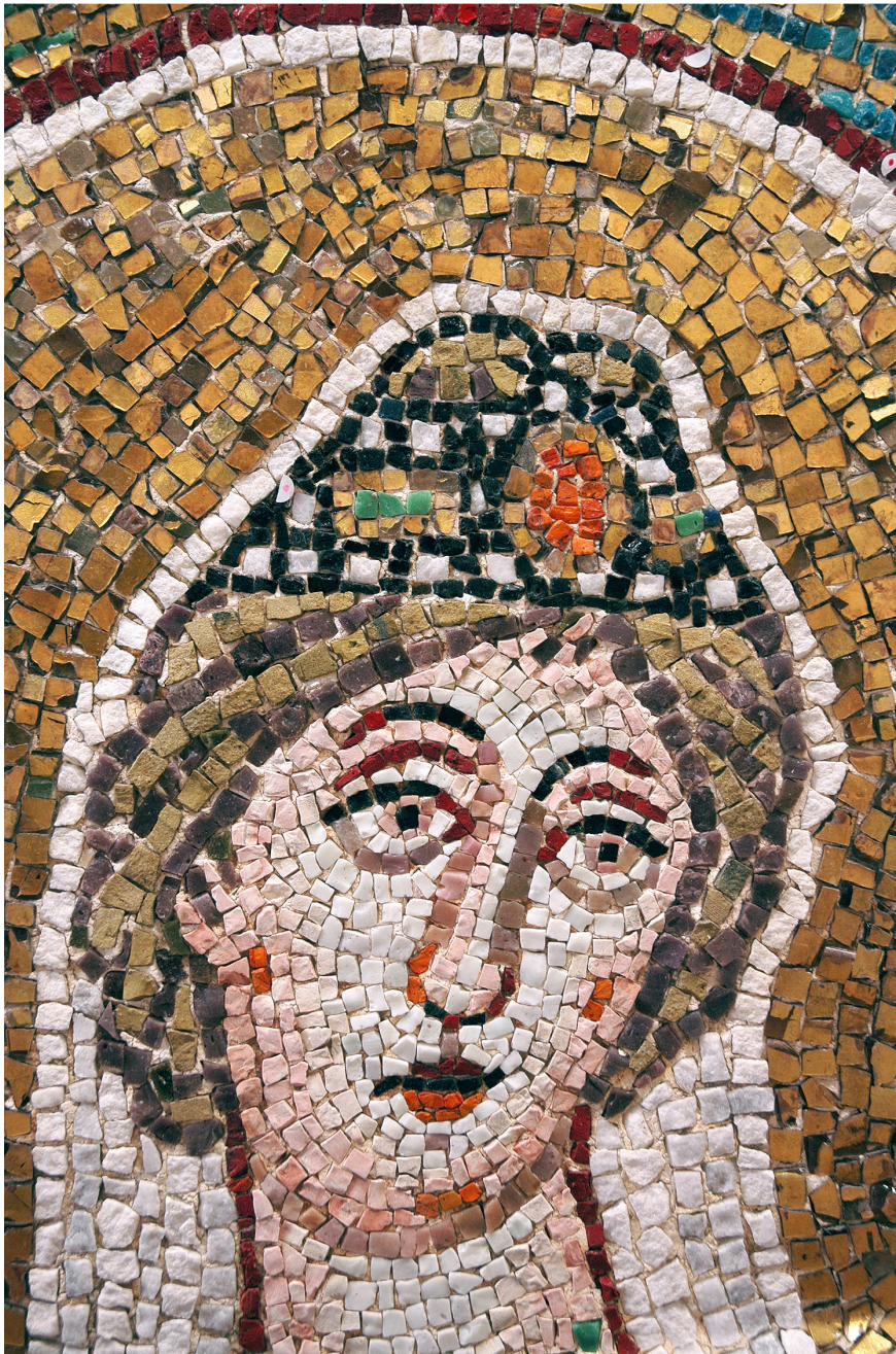
8 la Vergine Vittoria