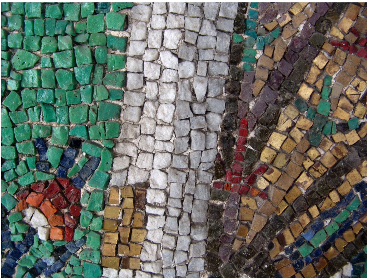
3 3° registro epoca agnelliana tessitura musiva fra le Vergini. Grande varietà di materiali: vetro, marmo, oro e tessere di cotto.