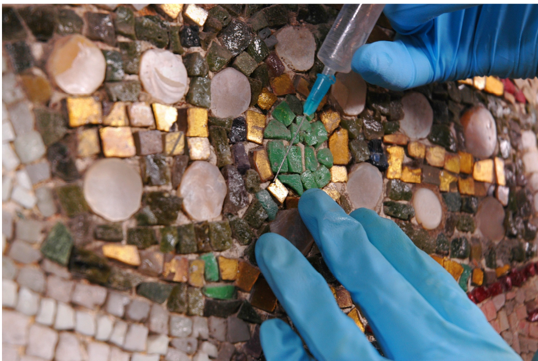
6 si nota l'inserimento novecentesco di bottone in madreperla