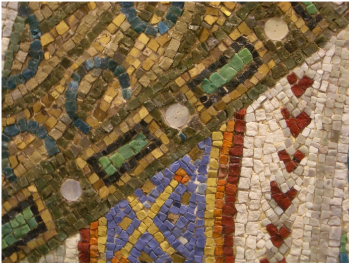
5 particolare degli ornamenti delle vergini- abbondante uso di madreperle